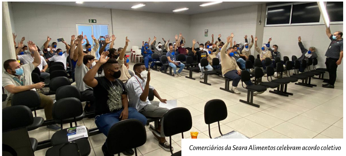
Comerciários da Seara Alimentos celebram acordo coletivo

Após a reforma trabalhista, uma parte de nossa luta se concentra nas datas-base e no fechamento de convenções coletivas que garantam a manutenção dos direitos dos trabalhadores, mas na maior parte do ano, nossa luta é por garantir seu cumprimento e conquistar acordos melhores, que somem benefícios e direitos dos trabalhadores em cada empresa.